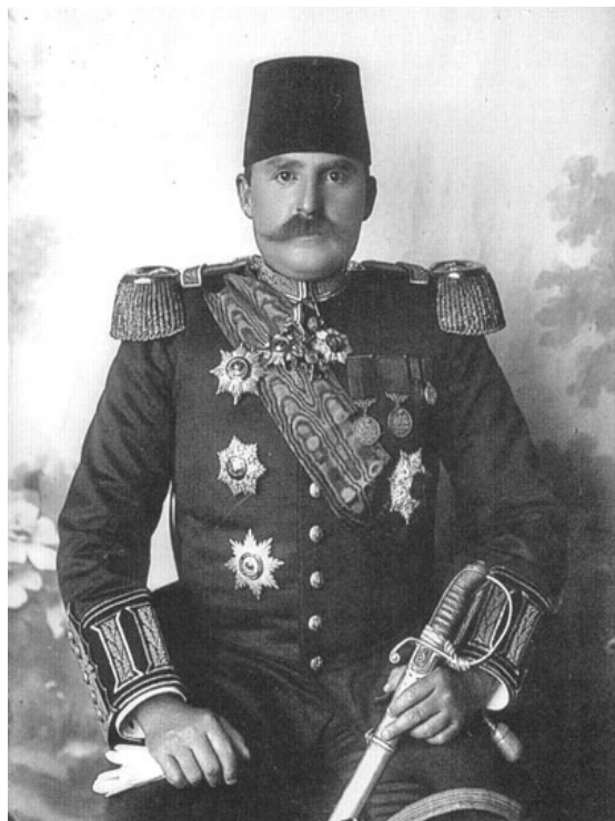
Esat Pashë Toptani